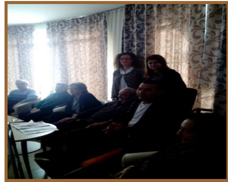
ПУСЗ „ТЕРЗИЕВА“, 2015.