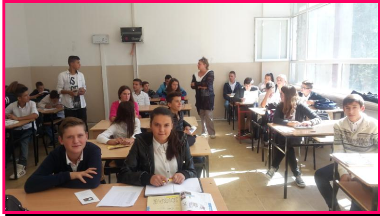
SHMQSH „Cvetan Dimov“ – komuna e Çairit , 2015.

Në ligjëratat janë përfshirë temat në vijim: