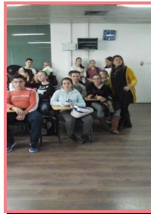
ДМБЦУ „Илија Николовски- ЛУЈ“ – општина Центар, 2015.