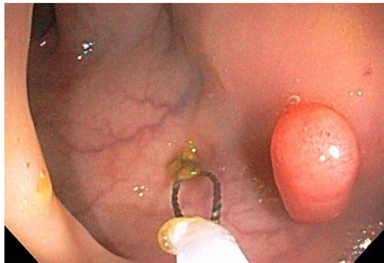
Центар за семејна медицина, Медицински Факултет Скопје 2013