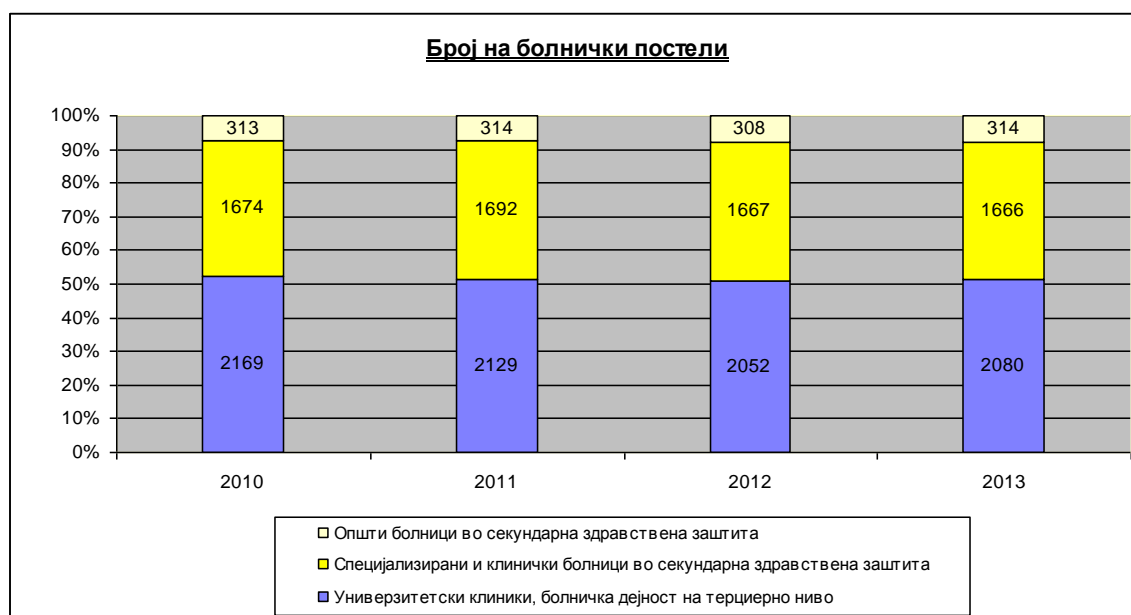
Слика 1. Структура на постелните капацитети во болничките здравствени установи, вкупно, на територијата на Центарот за јавно здравје Скопје, прикажани според видот на здравствената установа и нивото на здравствената заштита, 2010-2013 година. Податоците ги исклучуваат капацитетите на дневните болници.

Бројот на постели лесно преодминира во интернистичките гранки на универзитетските клиници во терциерната здравствена заштита, со вкупно 1100 постели или со пропорција од 53,3%. Така, хируршките универзитетски клиници, во 2013 година располагаат со 963 постели или со пропорција од 46.7%.