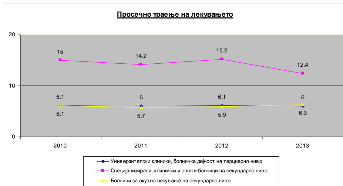
Слика 3. Просечно траење на лекувањето, Скопски регион, 2010-2013 година.

лекување во 2013 година е 8.2 денови, што е под нивото на вредноста за Европскиот регион и ЕУ во просек од 9,5 и 9,1 денови, соодветно во 2011 година (последен достапен податок). Овој показател во акутните болници на секундарно ниво на територијата на Центарот има вредност од 6.3 денови во 2013 година што е под просекот на Р.Македонија од 7,8 денови во 2011 година (последен достапен податок), и под просекот за Европскиот регион и ЕУ од 7,6 и 6.4 денови, соодветно во 2011 година (последен достапен податок). Просечното траење на лекување е 6,0 денови во универзитетските клиника на терциерно ниво, во регионот во 2013 година.