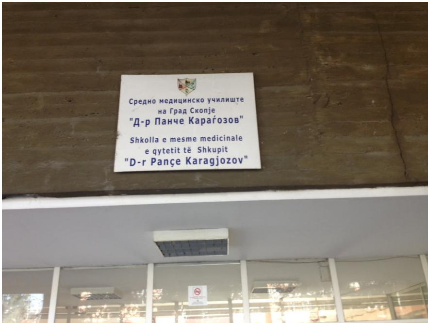
СМУ на Град Скопје „Д-р Панче Караџов“