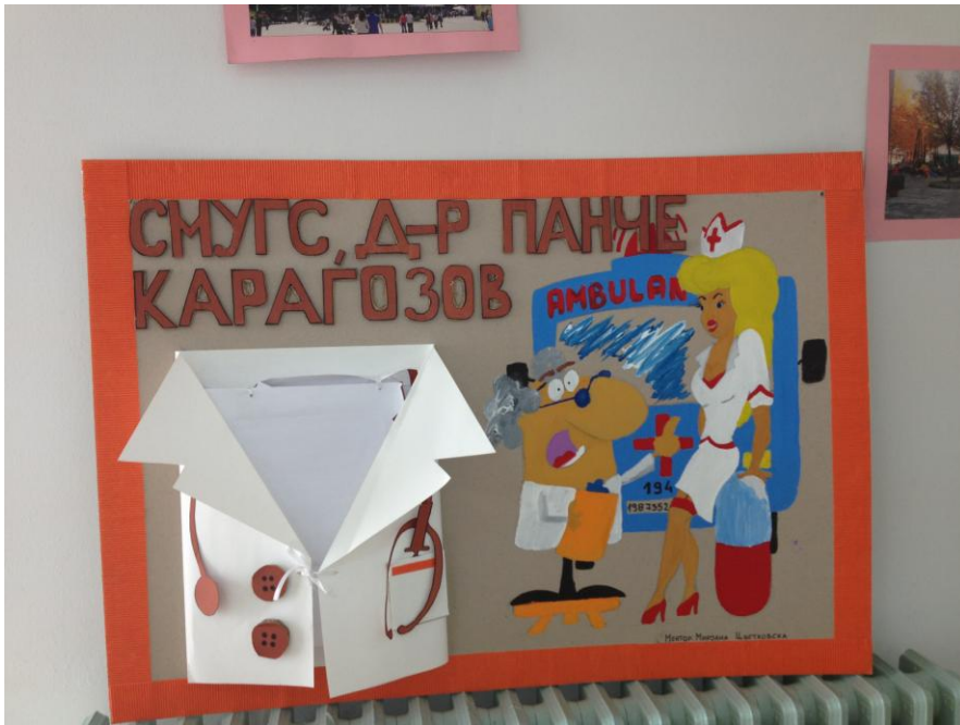
СМУ на Град Скопје „Д-р Панче Карагозов“