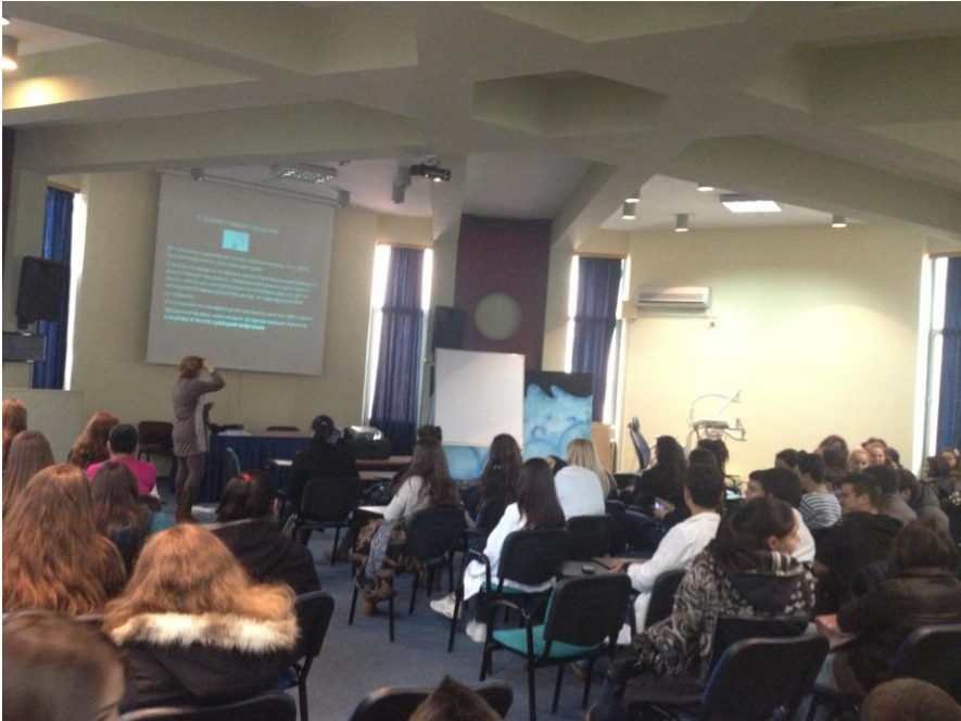
СМУ на Град Скопје „Д-р Панче Караџов“