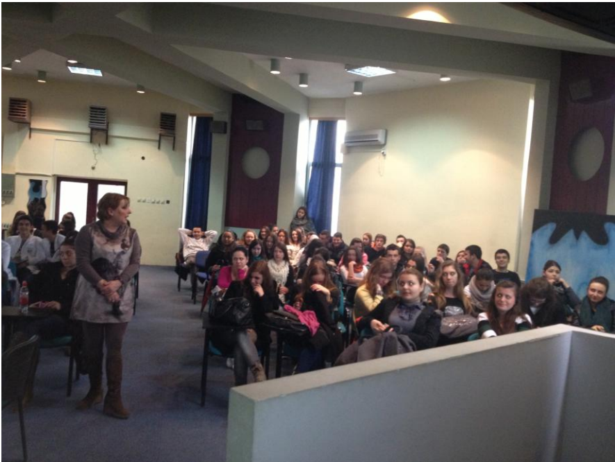
СМУ на Град Скопје „Д-р Панче Караџозов“