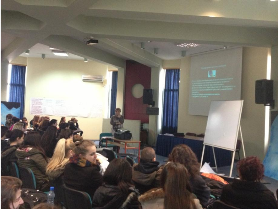
СМУ на Град Скопје „Д-р Панче Караџозов“