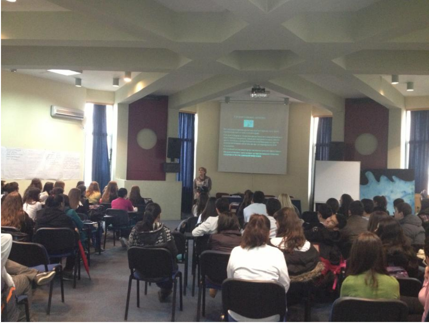
СМУ на Град Скопје „Д-р Панче Караџов“