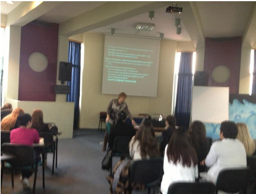
СМУ на Град Скопје „Д-р Панче Караѓозов“

Со здравствена едукација и промоција на здравјето на младите во март 2013 година се опфатени 65 паралелки и вкупно 2300 ученици во Средното медицинско училиште на град Скопје „Д-р Панче Караѓозов“ на тема- Контрацепција, Сексуално преносливи болести и СИДА . Следува кратка фоторепортажа од реализираните предавања.