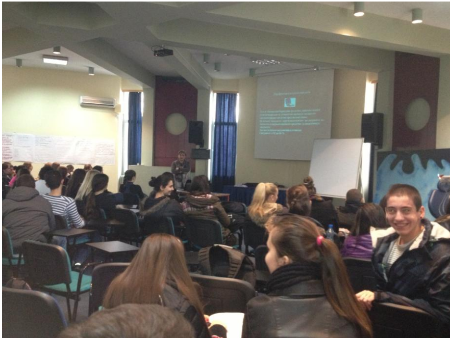
СМУ на Град Скопје „Д-р Панче Караџов“