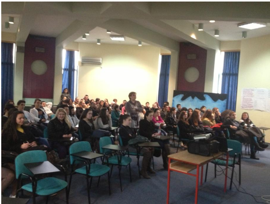
СМУ на Град Скопје „Д-р Панче Караџозов“