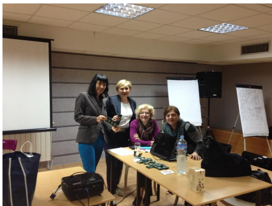
Обука за Советување и Тестирање за ХИВ/СИДА и СПИ, хотел Порта, Скопје