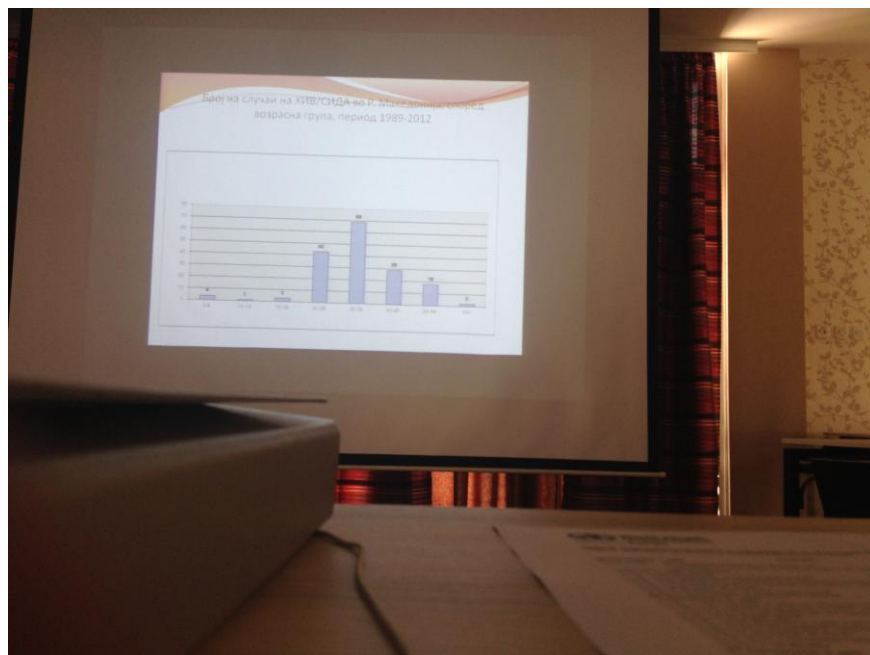
Обука за Советување и Тестирање за ХИВ/СИДА и СПИ, хотел Порта, Скопје