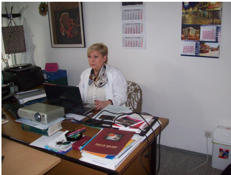
Центар за јавно здравје-Скопје, Одделение за социјална медицина, декември 2013 година.