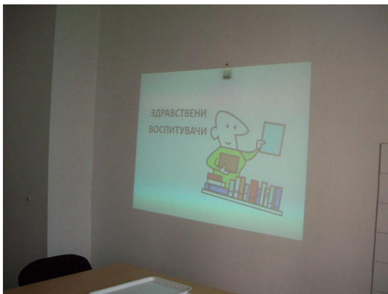
Центар за јавно здравје-Скопје, Одделение за социјална медицина, декември 2013 година.