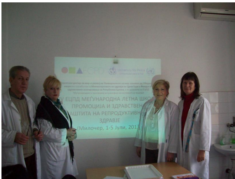
Центар за јавно здравје-Скопје, Одделение за социјална медицина, декември 2013 година.