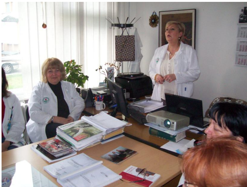
Центар за јавно здравје-Скопје, Одделение за социјална медицина, декември 2013 година.