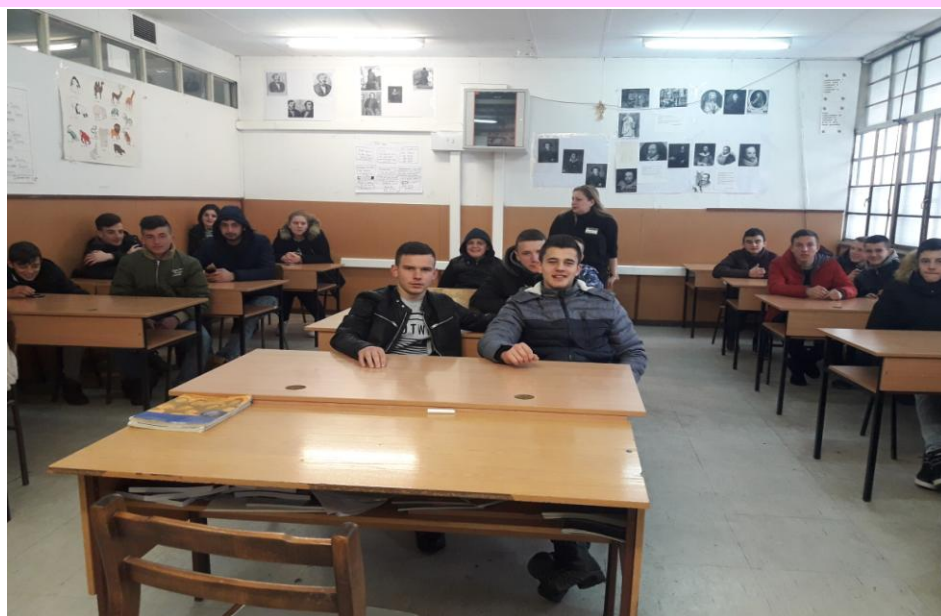
СУГС „КОЧО РАЦИН” ОПШТИНА ЃОРЧЕ ПЕТРОВ