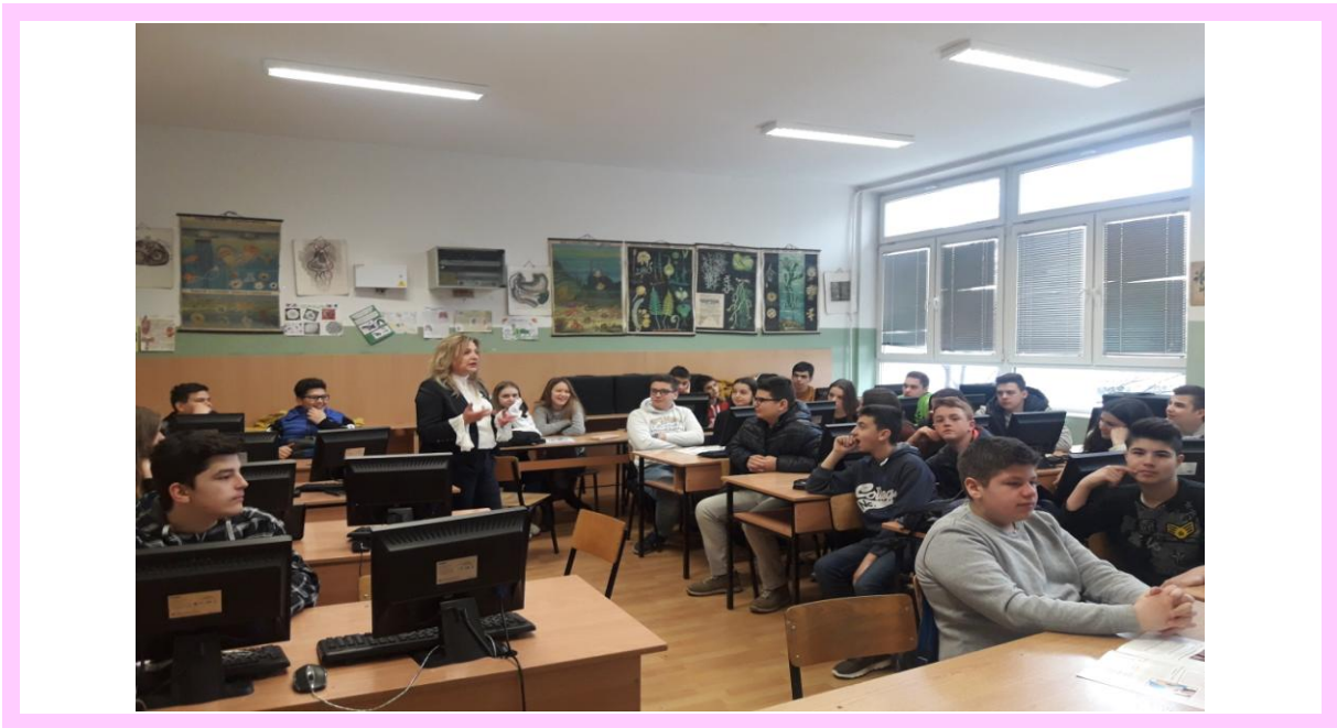
О.У. „КОЛЕ НЕДЕЛКОВСКИ” ОПШТИНА ЦЕНТАР