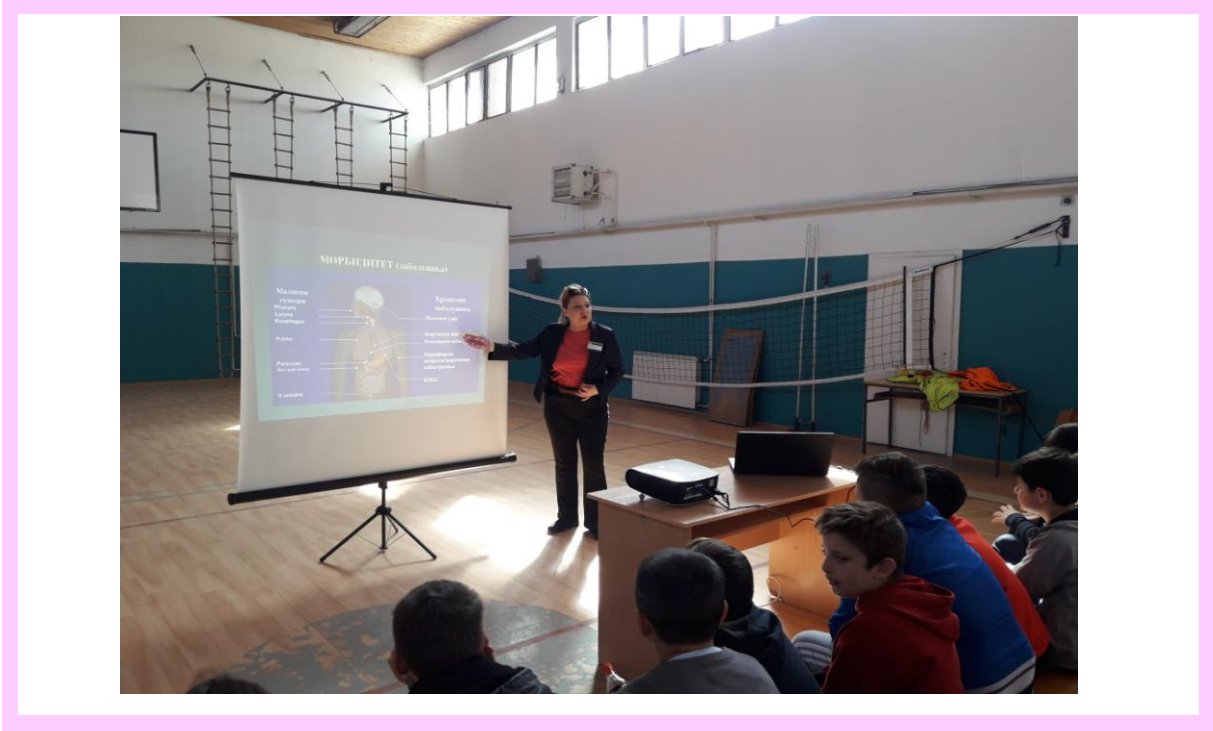
О.У. „ДРАГА СТОЈАНОВСКА” СЕЛО РАКОТИНЦИ, ОПШТИНА СОПИШТЕ