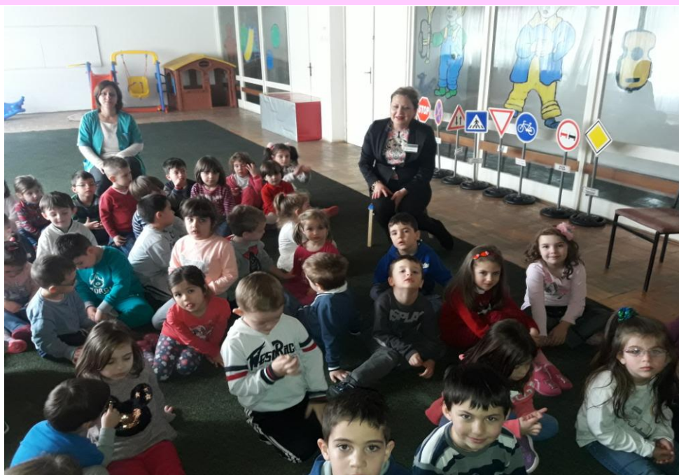
ЈДГ „11 ОКТОМВРИ” ОПШТИНА БУТЕЛ