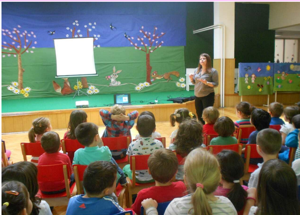
ЈДГ „ПРОЛЕТ”, ОПШТИНА КАРПОШ