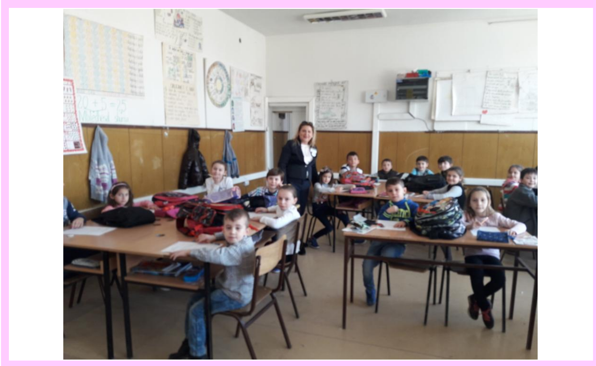
О.У. „НИКОЛА ВАПЦАРОВ” ОПШТИНА ЧАИР