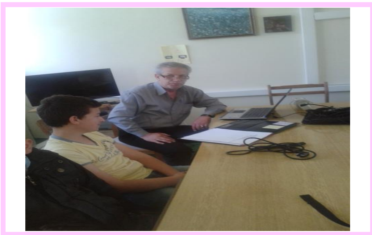
О.У „БАЈРАМ ШАБАНИ” ОПШТИНА АРАЧИНОВО