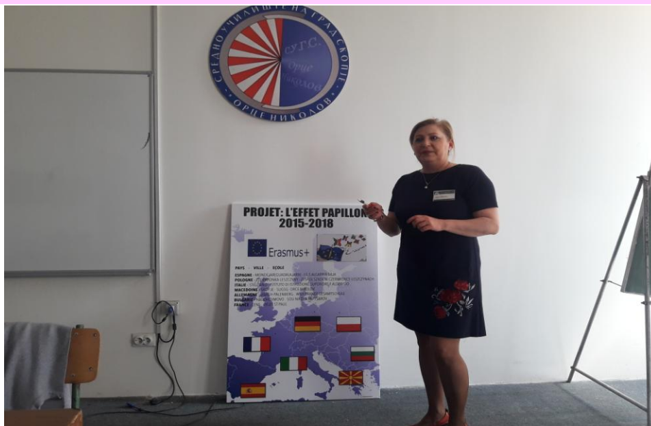
СУГС „ОРЦЕ НИКОЛОВ” ОПШТИНА КАРПОШ